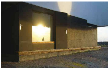
Sistema SATE corcho