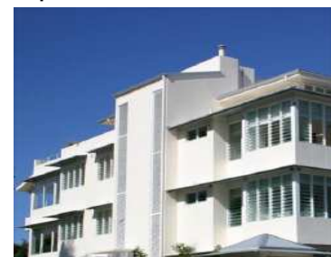
Sistema GECOL TERM ETICS rehabilitación