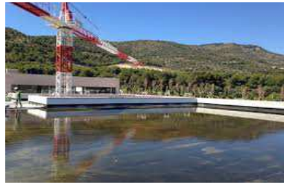
EPDM RESITRIX autoadhesivo. Prueba de estanqueidad