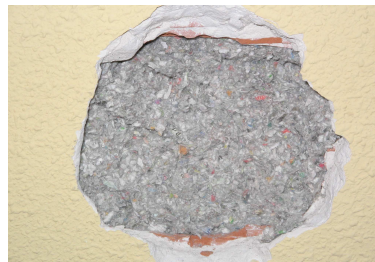
Celulosa insuflada en cámara