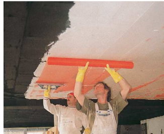
Rehabilitacion Interior sin obras y en edificios con patologias.