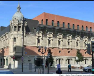
Ligereza, Seguridad, Resistencia a la Compresion en cubiertas metalicas, pedestres y parking