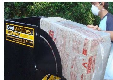
Maquina de insuflado Corcho