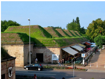
El estándar Passivhaus.