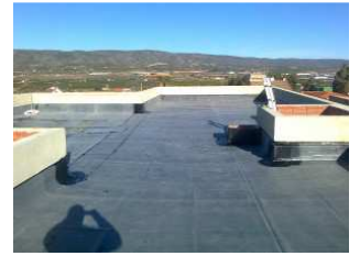
EPDM, características y soluciones de cubiertas y enterradas.