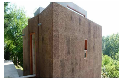
Sistema SATE corcho sin revestir a la intemperie