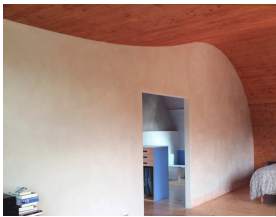
Placas de arcilla ecoclayPLAC en Arquitectura Ecológica.