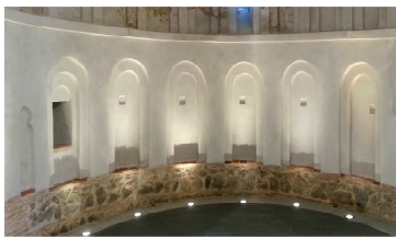
Ecoclay en Restauración de Patrimonio