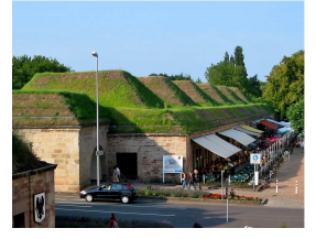
La Eficiencia y la Seguridad.