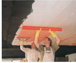
Rehabilitación Interior sin obra y en Edificios con Patologías