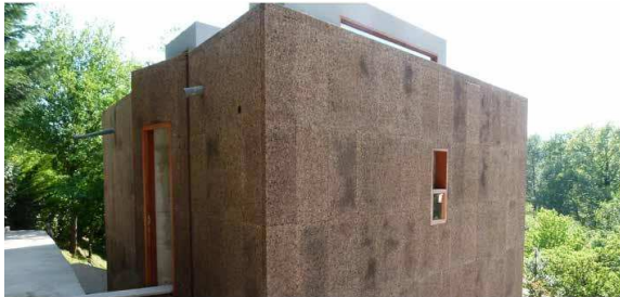
Placas de corcho SATE INTEMPERIE en Arquitectura Ecológica