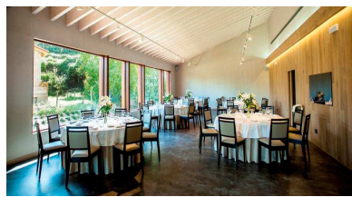
Ecoclay en restaurantes, mejor absorción acústica, más confort.