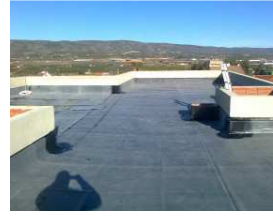
EPDM de SOCYR, características y soluciones de cubiertas y enterradas