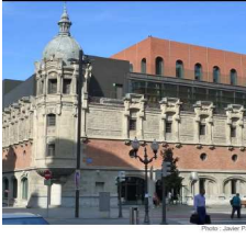
Ligereza, Seguridad, Resistencia a la Compresión con vidrio celular FOAMGLAS®.