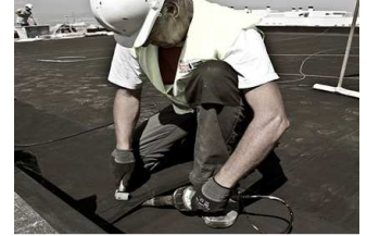
Sistema Compacto de EPDM : Novedad y sistemas compactos.